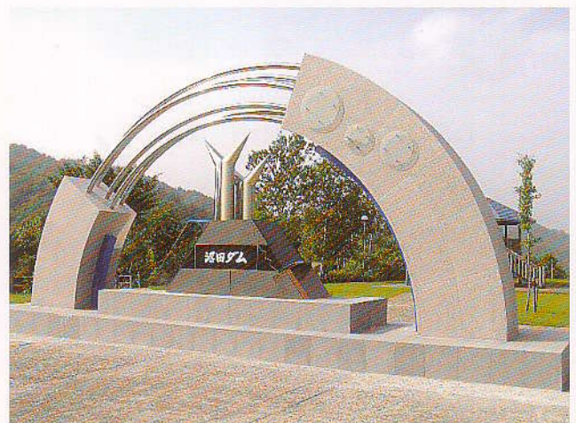
公園モニュメント